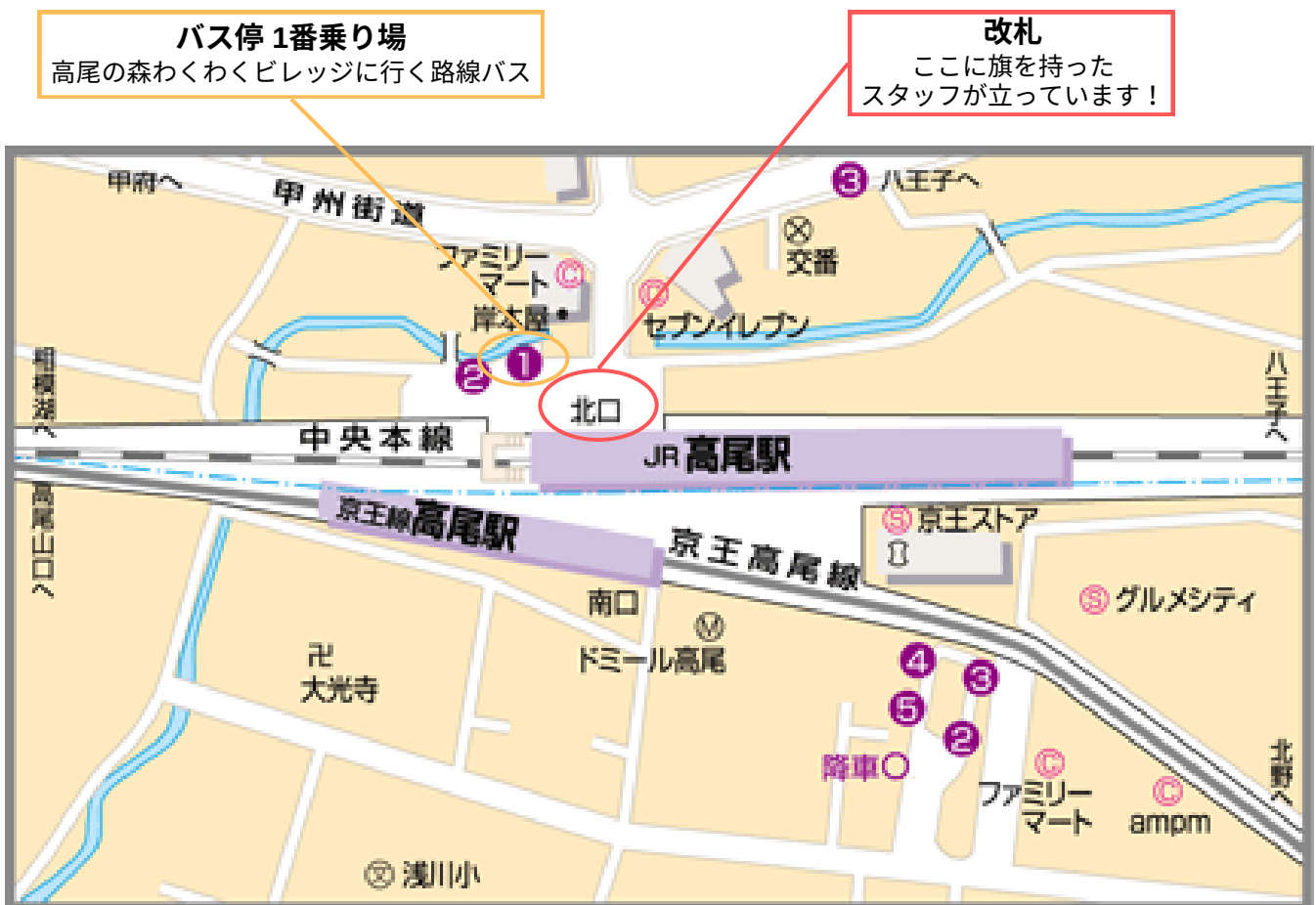
西東京バスWebページ地図

京王線で到着した場合も、連絡改札口を使って北口に出ることができます。 案内板に沿って歩けばたどり着けますが、不安な場合は駅員さんに聞いてください。