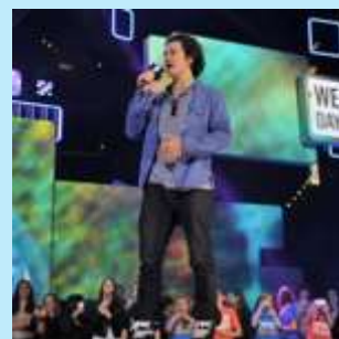
■ オーランド・ブルーム