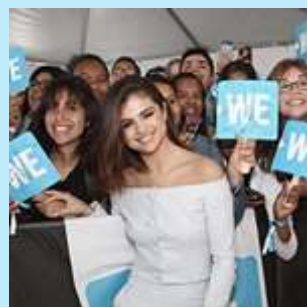
■ セレーナ・ゴメス