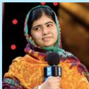
■ マララ・ユスフザイ